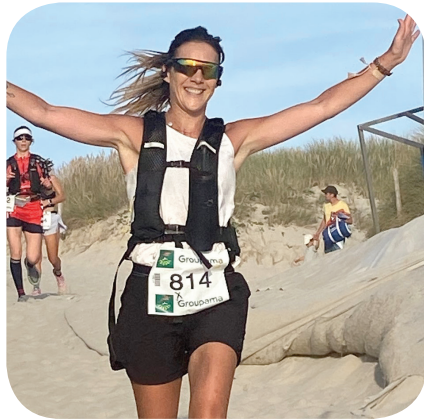
20h00, à l'entrée sur la plage pour le dernier km, il reste les sourires