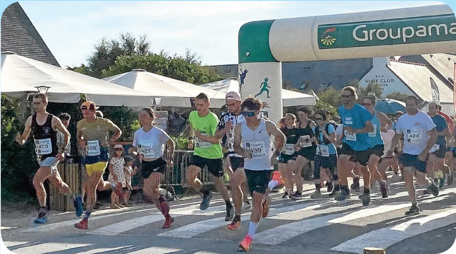
à 18h30, les ces premiers coureurs se sont élancés prêts à en découdre avec le chrono.