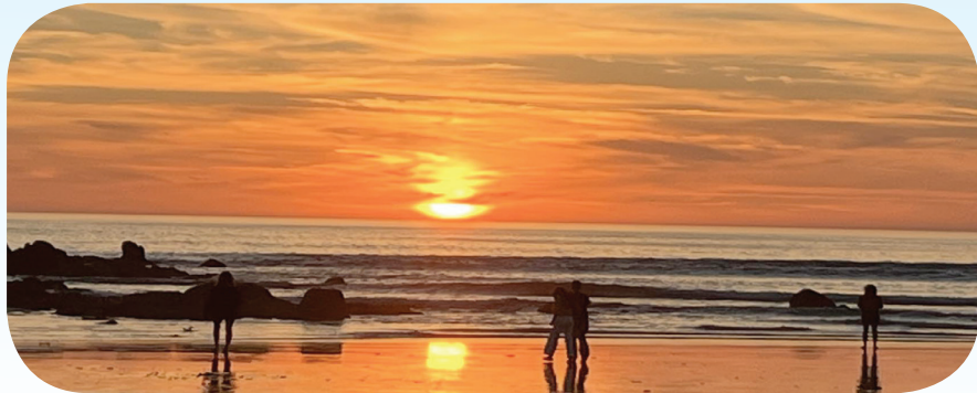
Le magnifique spectacle que nous a offert le Soleil couchant à la Pointe de la Torche, le 23 août à l'arrivée du Trail. Même les coureurs se sont arrêtés avant la ligne pour immortaliser ce moment.