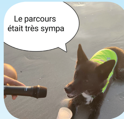
Les réactions de Nora, la runneuse à quatre pattes d'Arnaud, fondateur de «Bref je fais du running» après avoir couru la grande boucle du Trail des Étoiles de la Baie.